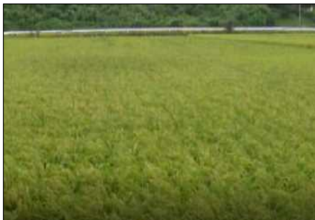
左写真1 ヒメノモチ 鉄黒コート 湛水直播圃場

坪刈りによる収量調査。収量差に遜色は無く、2017年の鉄コーティングと比較すると鉄黒コートに切り替え後の2020年は、 単収 10aあたり20kg増加 した。