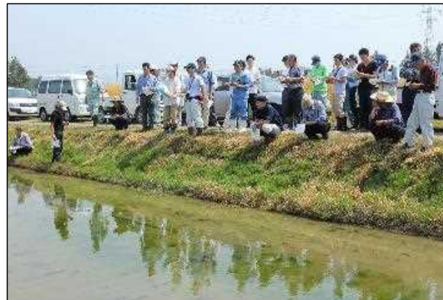
左写真2 直播研究会 圃場巡回様子