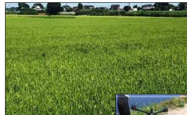
ドローン散播圃場